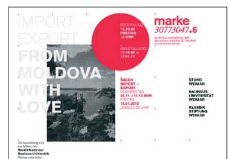
Flyer zur Ausstellung

Die Initiative Synapsen, 2008 von Weimarer Studierenden und Alumni gegründet, hat in Chisinau, der Hauptstadt der Republik Moldau ein leer stehendes Zirkusgebäude als Raum für Experimente wiederbelebt. Synapsen vereinte Künstler, Designer und Kulturwissenschaftler aus Deutschland, Italien, Rumänien und der Republik Moldau in einem kreativen Schaffensprozess. In aktiver Auseinandersetzung