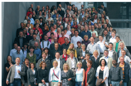
Gruppenbild Matrikeltreffen 1984.

(orgteam) Immerhin 160 ehemalige Studierende der Sektionen 1, 3 und 5 bzw. Architektur, Baustoffverfahrenstechnik und Städtebau/Gebietsplanung feierten am zweiten Septemberwochenende den 25. Jahrestag ihrer Immatrikulation an der Bauhaus-Universität Weimar.