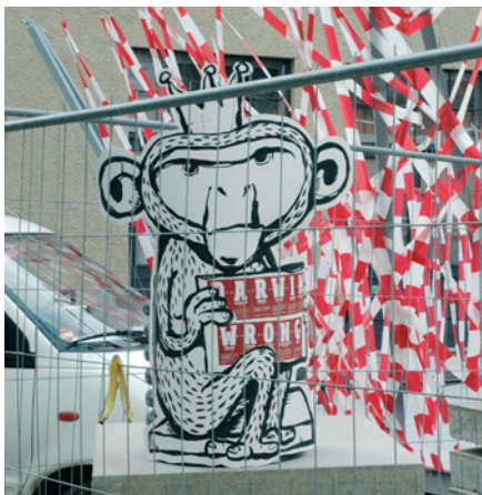
Aufnahme während der summary 2009.

Erlebt – Fotografiert – Gefunden! Bauhaus in Bildern – wir wollen sie zeigen! 90 Jahre Bauhaus – diesen 90. Geburtstag feierte und feiert die Bauhaus-Universität Weimar mit fast 90 Festen, Tagungen, Ausstellungen, Filmvorführungen und Workshops.