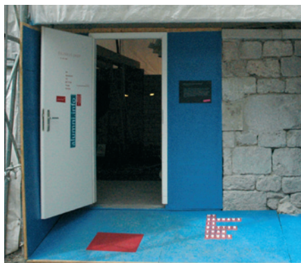
Portal Bauhaus.Atelier, Info und Shop, Geschwister-Scholl-Straße 6a.

Herzlich möchten wir hier nochmals unsere Alumni begrüßen, die sich im vergangenen Quartal entschlossen haben, mit uns, ehemaligen Kommilitonen und Mitarbeitern in Kontakt zu bleiben. Wir freuen uns über Ihre Anmeldung im Portal.