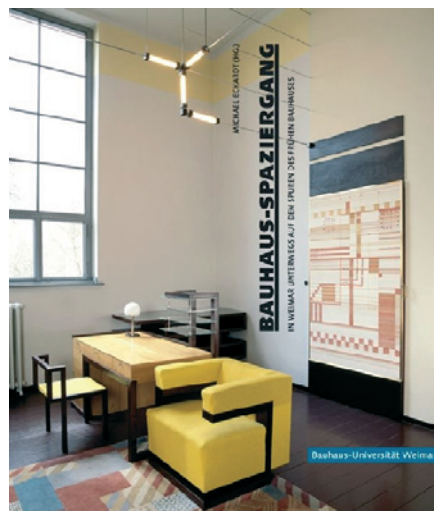
Cover der Publikation »Bauhaus-Spaziergang – In Weimar unterwegs auf den Spuren des frühen Bauhauses«

Wandeln auf den Spuren des frühen Bauhauses – das praktizieren schon seit 2006 die studentischen Guides des Bauhaus-Spaziergangs mit ihren Gästen. Die Geschichte und Gegen-