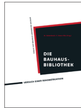
Cover der Publikation »Die Bauhaus-Bibliothek – Versuch einer Rekonstruktion«.

Es gibt kaum eine Bildungseinrichtung, deren Wirken ähnlich gut aufgearbeitet ist, wie das Wirken des Staatlichen Bauhauses, das 1919 von Walter Gropius in Weimar gegründet wurde. Daher verwundert es, dass die im Original erhaltenen Teile der Bauhaus-Bibliothek im Altbestand der Universitätsbibliothek der Bauhaus-Universität Weimar von der wissenschaftlichen Literatur zum Bauhaus bisher nicht beachtet wurden.