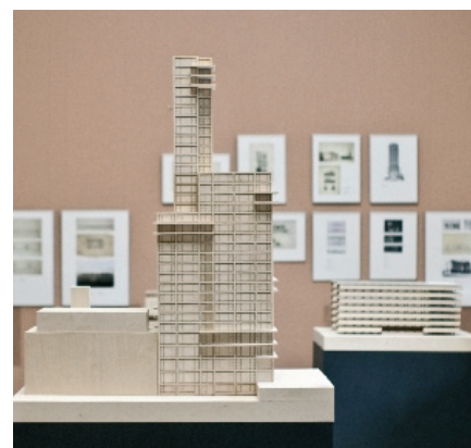
Blick in die Ausstellung.

An der Ausstellung »Architektur. Ausstellungen am frühen Bauhaus in Weimar 1919 – 1922 – 1923« erfreuten sich über 5.300 Besucher in den Monaten Juli bis September 2009. Weitere Informationen dazu können Sie der Internetseite entnehmen.