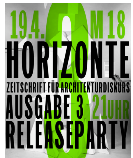
Release-Plakat zur 3. HORIZONTE-Ausgabe

HORIZONTE feiert die Veröffentlichung der dritten Ausgabe und den ersten Geburtstag von HORIZONTE – Zeitschrift für Architekturdiskurs. Die aktuelle Ausgabe betrachtet unter dem Titel »Re-Definition – Architektur auf der Suche nach neuen Wegen« eine neue Generation von Architekten, Planern und Theoretikern, welche durch unkonventionelle Strategien neue Nischen im etablierten System der Architekturproduktion des 21. Jahrhunderts besetzen. Das Magazin baut dabei auf Interviews mit Vortragenden der vergangenen HORIZONTE-Vortragsreihe auf und wird durch Essays, eine Photoreihe sowie Projektbeschreibungen inhaltlich komplettiert.