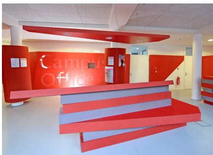
Der interaktive Tresen des neuen Campus.Office

Die Dezernate Studium und Lehre sowie Internationales rücken näher zusammen: Seit Anfang des Jahres sind beide Bereiche im frisch renovierten Campus.Office gegenüber dem Hauptgebäude der Universität untergebracht. Produkt-Design-Studierende der Universität gestalteten die Empfangshalle des neuen Service-Zentrums.