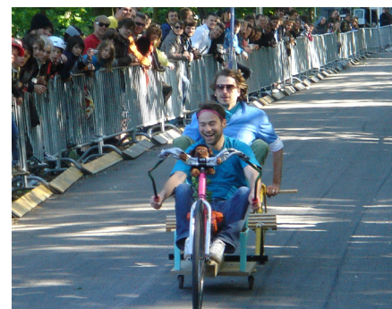
Die Zeit entschied über den Sieg beim zweiten Rennen.

In guter, alter Tradition fand am 1. Mai wieder das alljährliche Weimarer Seifenkistenrennen um den Spacekidheadcup statt. Von Studierenden auf Non-Profit-Basis organisiert und vom KulturTragWerk e.V. unterstützt, gingen auch dieses Jahr wieder viele bunte, kreative, skurrile und zum Teil waghalsige Rennkisten an den Start. Unter den kritischen Augen einer fachkundigen Jury und angefeuert von hunderten Zuschauern rauschten 52 Seifenkisten bei strahlendem Sonnenschein die 140m lange Rennstrecke auf der Belvederer Allee hinunter –