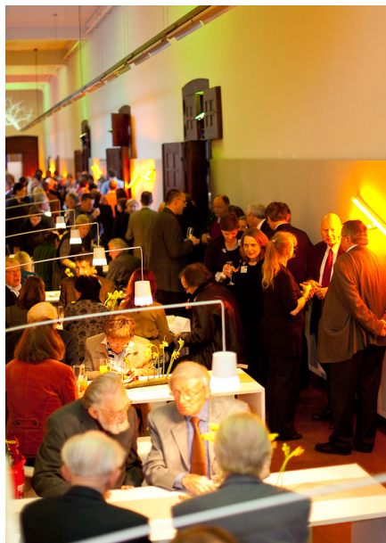
Abschiedsfest im Hauptgebäude