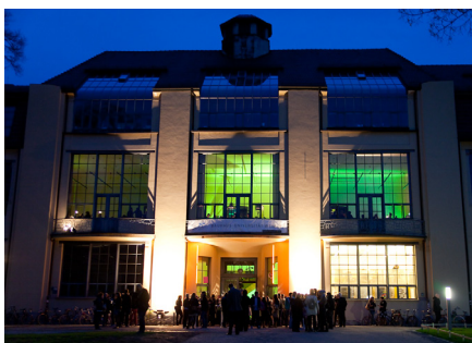
Hauptgebäude zum Abschiedsfest