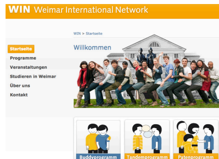
Website Weimar International Network

Pünktlich zu Beginn des Sommersemesters hat das International Office der Bauhaus-Universität Weimar die vom DAAD geförderte Website WIN – Weimar International Network – ins Leben gerufen: Ein Service zur Verbesserung der Vernetzung von internationalen und deutschen Studierenden.