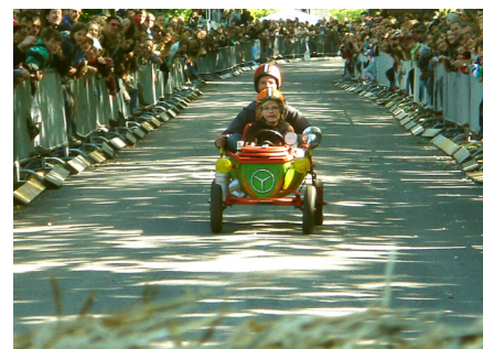
Die erste Abfahrt galt den Kreativen.

In guter, alter Tradition fand am 1. Mai wieder das alljährliche Weimarer Seifenkistenrennen um den Spacekidheadcup statt. Von Studierenden auf Non-Profit-Basis organisiert und vom KulturTragWerk e.V. unterstützt, gingen auch dieses Jahr wieder viele bunte, kreative, skurrile und zum Teil waghalsige Rennkisten an den Start. Unter den kritischen Augen einer fachkundigen Jury und angefeuert von hunderten Zuschauern rauschten 52 Seifenkisten bei strahlendem Sonnenschein die 140m lange Rennstrecke auf der Belvederer Allee hinunter –