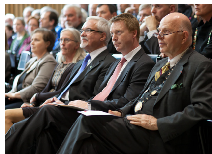
Investitur des Rektors im Audimax