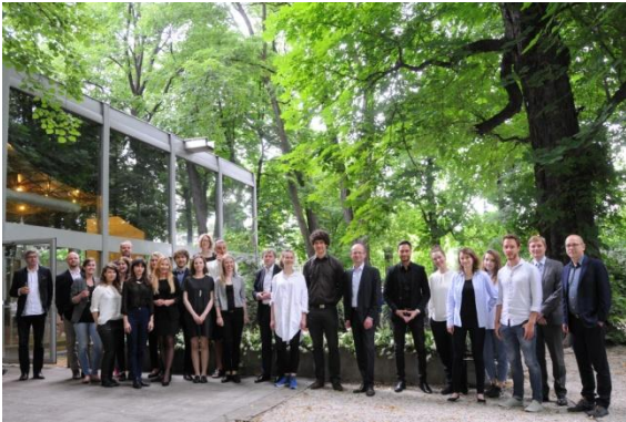
alle Teilnehmer am BDA-SARP-Award 2015